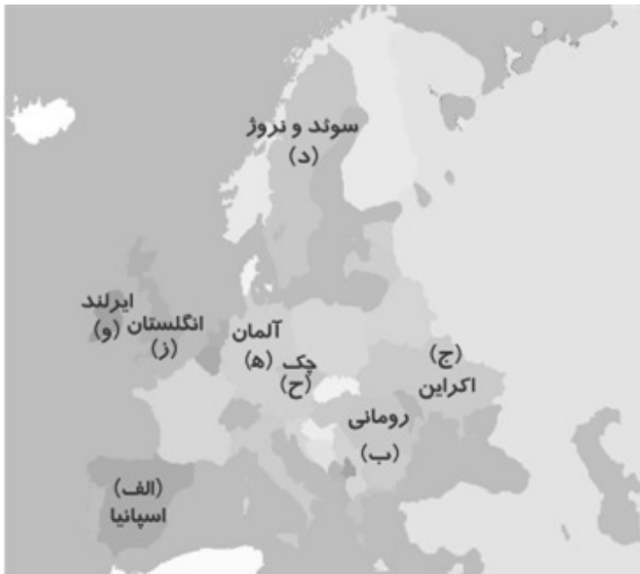
«نواحی صنعتی مهم در قاره اروپا»